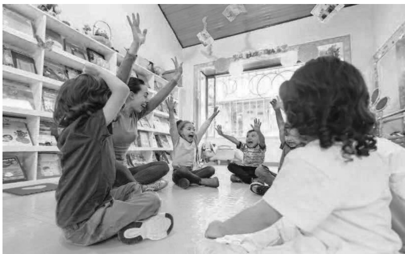
Figura 3- Brincadeiras e acolhimento na creche