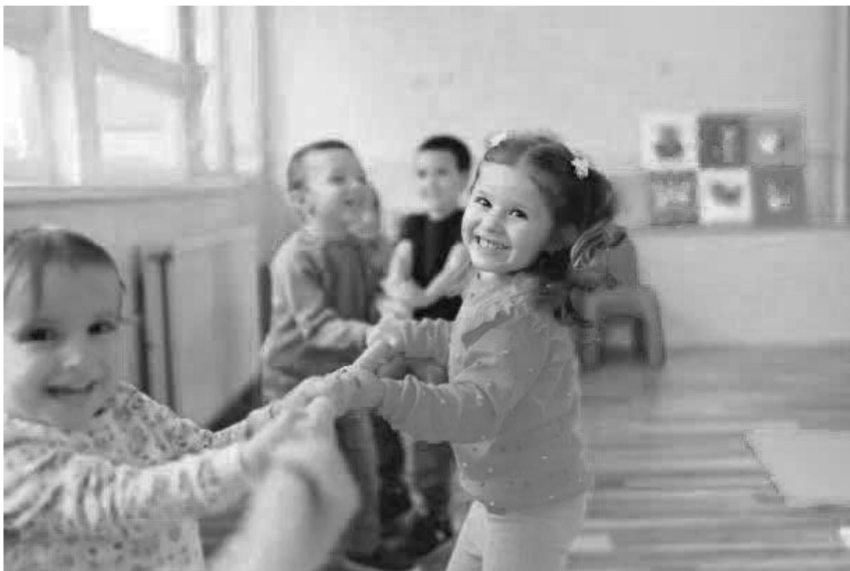
Figura 1 – Crianças em ambiente de creche/pré-escola.

Fonte: Unsplash, autor não informado, acesso em 03 nov. 2025.