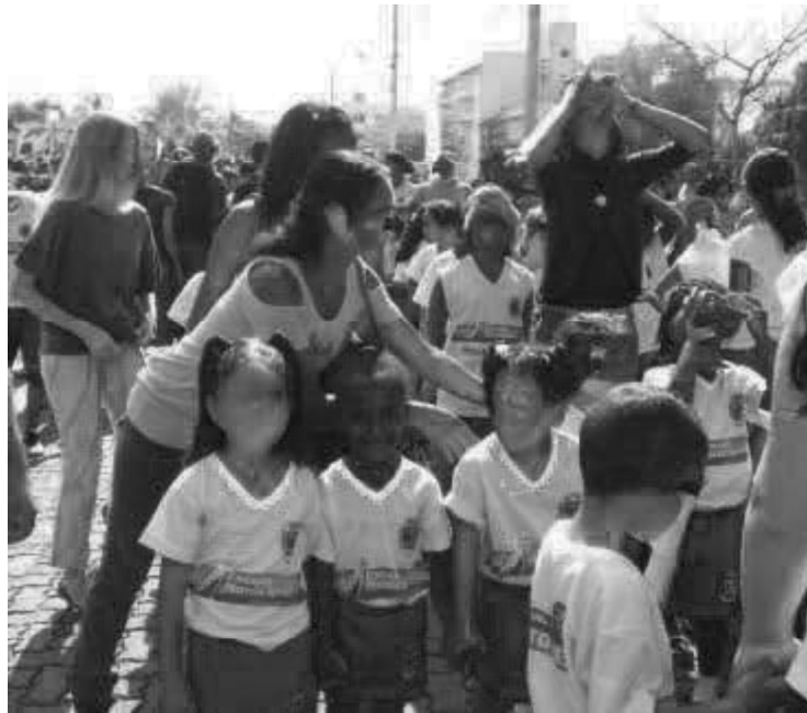
Figura 1 – Desfile Municipal da Cidade de Porto Real