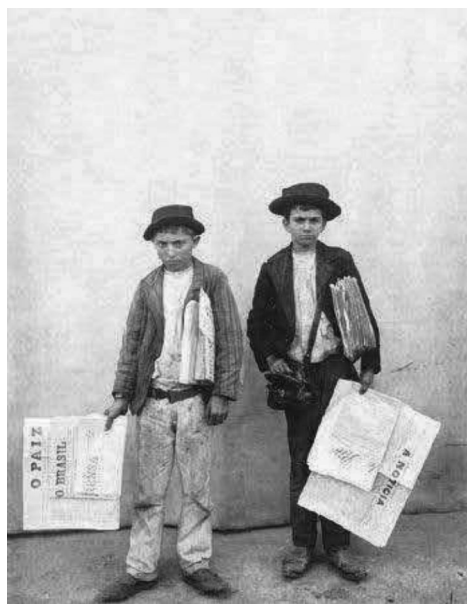
Figura 4 - Foto de dois meninos entregadores de jornal, 1899.