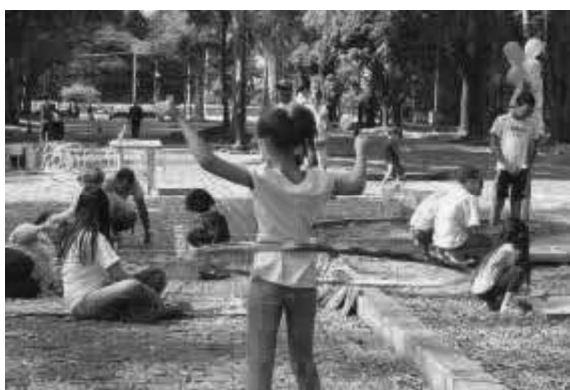
Figura 5 - Crianças brincando em espaço livre

A concepção infância ainda é um espaço disputado, pois a infância é um lugar complexo, individual e ao mesmo tempo coletivo, se caracterizando como atemporal (Bezerra et al., 2014). Não se pode dizer que ela é apenas uma fase da vida, marcando somente um período biológico 10 , e por isso, a infância das crianças precisa ser considerada em todo e qualquer contexto, seja social, político e principalmente no educacional.