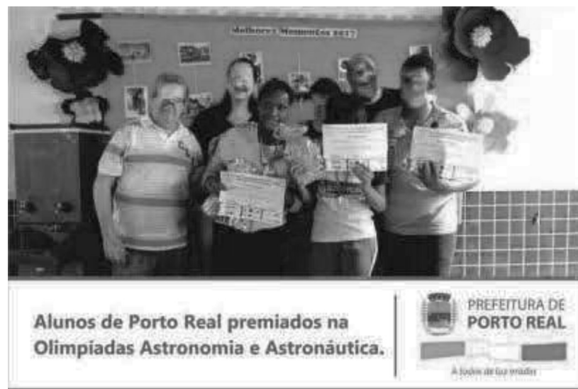
Figura 2 - Prêmio pela colocação nas Olimpíadas de Astronomia e Astronáutica pela Rede Municipal de Educação de Porto Real

Com o passar dos anos, fui perdendo um pouco do encanto pela escola, ou melhor, pela forma na qual ela se conduzia. Ao chegar no Ensino Fundamental II, minha relação com o ambiente escolar mudou. Já não gostava tanto de ir para a escola, os laços afetivos com os professores diminuíram, e a escola deixou de ser um lugar em que eu me sentia acolhida. Ainda assim, permaneci, firme, tentando encontrar sentido em cada nova etapa, me esforçando e dando o melhor de mim no que realizava.